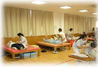
クリニック内併設のデイケア