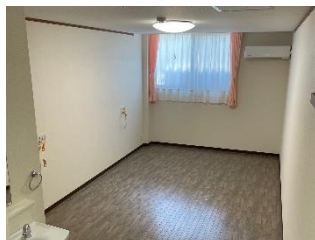
夫婦部屋としても可能（21㎡）