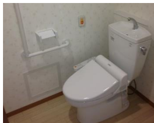
お部屋内にトイレ