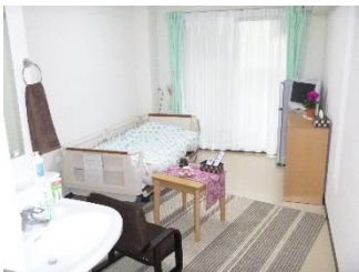
居室（モデルルーム）

1ルーム（18㎡～21㎡）・冷暖房・トイレ・洗面台 照明器具・ナースコール・クローゼット・ベランダ