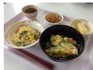
毎日温かい食事を提供