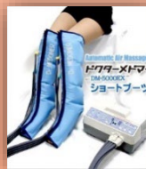
・Dr.メドマー ・イージーウォーク