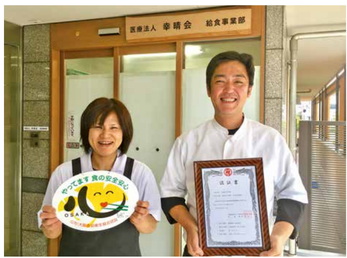
笑顔が素敵なの河野料理長(左)と渋谷センター長(右)