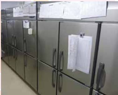
厨房内の大容量の冷蔵庫や冷凍庫