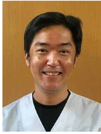
CK給食事業部センター長