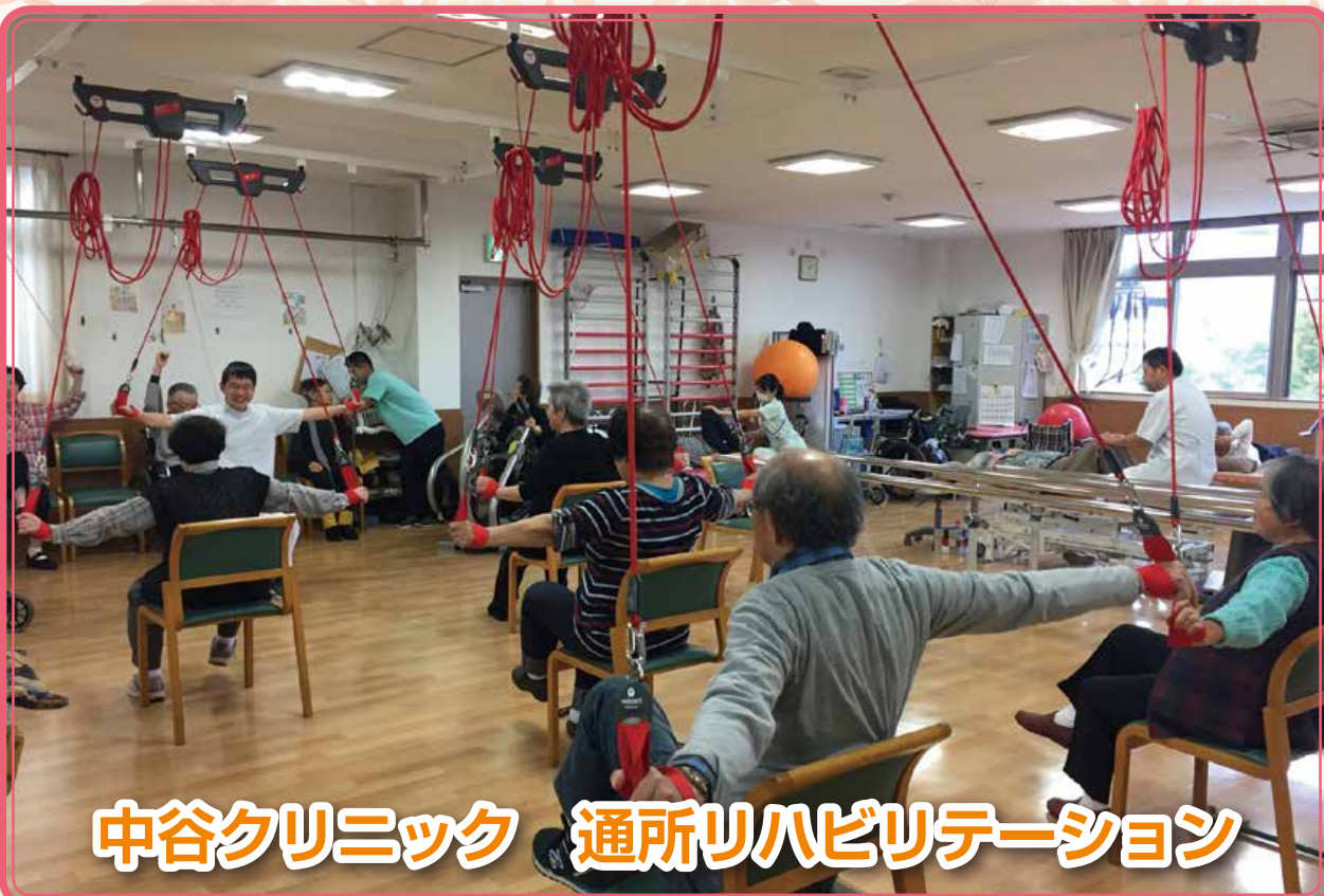
中谷クリニック 通所リハビリテーション