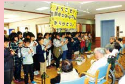
美しい音色のリコーダー演奏もして頂きました