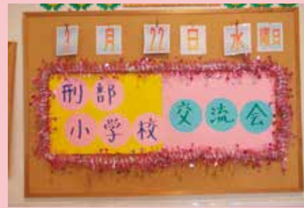
入居者様も手作りのウェルカムボードをご用意