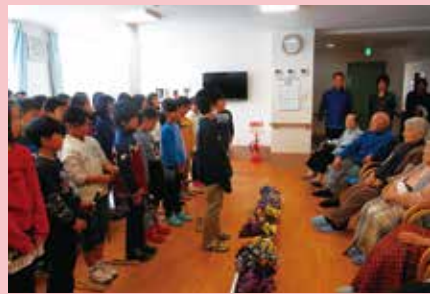
児童様の挨拶と共にたくさんのお花を頂戴しました